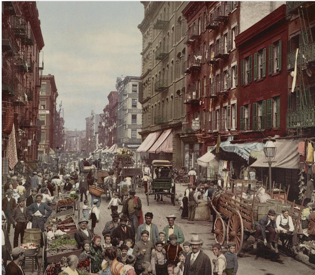
Ciudad de Nueva York 1900